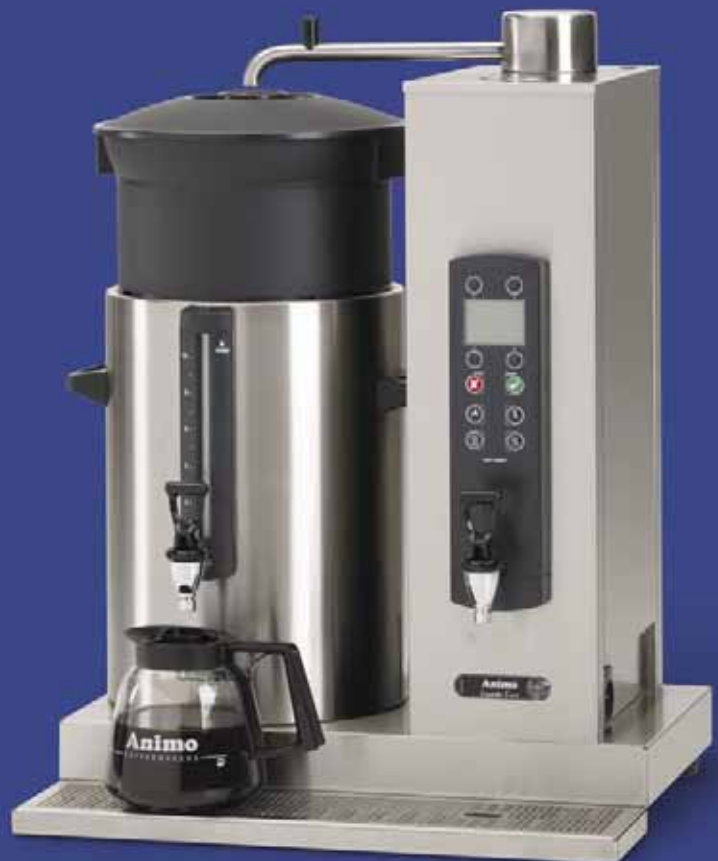
ComBi-line met een links geplaatste container van 10 liter en separate waterkoker in de zuil: CB 1x10W L.

Naast deze gebruikersinstellingen geeft het bedieningspaneel ook toegang tot de operator- en serviceomgeving. Deze laatste twee zijn alleen te bedienen met een pincode. U vindt er de instellingen voor het beheersen van het koffiezetproces, voor de gescheiden waterkoker en voor service en onderhoud.