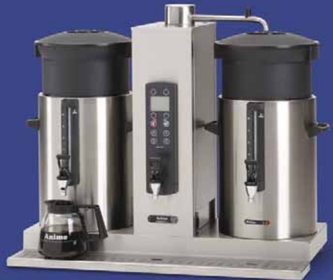
ComBi-line met twee containers van 10 liter en separate waterkoker in de zuil: CB 2x10W.