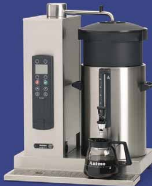
ComBi-line met een rechts geplaatste container van 10 liter: CB 1x10 R.