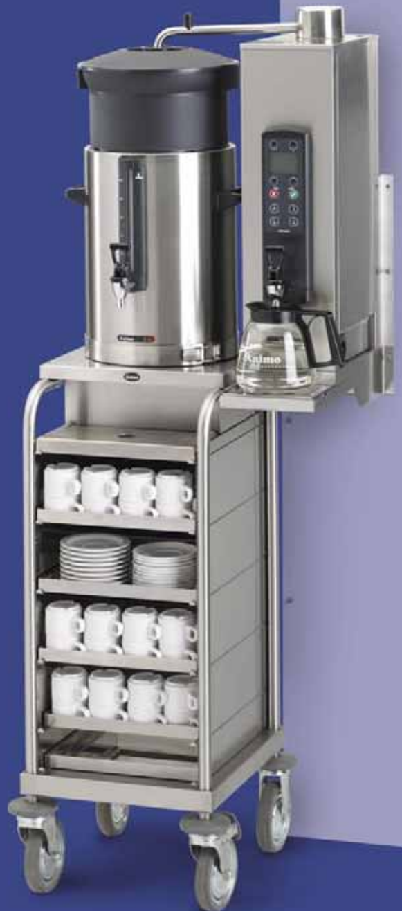
CB 10W aan de wand gemonteerd.

Ook voor het decentraal serveren van koffie en thee biedt Animo's ComBi-line perfecte mogelijkheden. Een ideale opstelling is de combinatie van een aan de wand bevestigde doorstroomwaterkoker met een container en serveerwagen. Is de koffie of thee klaar, dan verwijdert u het filter; een geïsoleerd deksel zorgt ervoor dat de container veilig kan worden vervoerd.