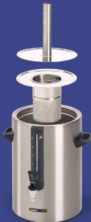
Voor het zetten van thee in een container plaatst u het speciale theefilter met vulpijp.